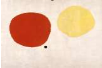
La magie de la couleur

Les tableaux de Miro ont-ils été une source d'inspiration pour Gavin Kos ?